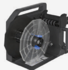
TU-RC7508 (Accesorio opcional - no viene incluido)